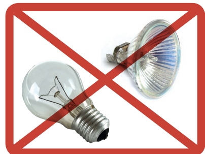
Halogenei- ja hehkulamput » sekajätteeseen