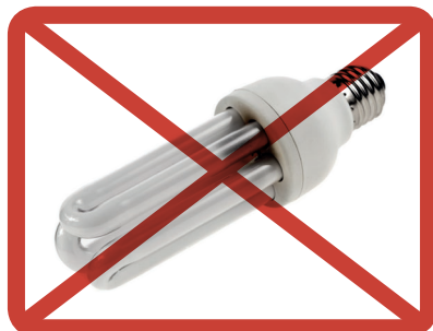
LED- ja energiansäästölamput, loisteputket » sähkölaitteiden tai vaarallisen jätteen keräykseen