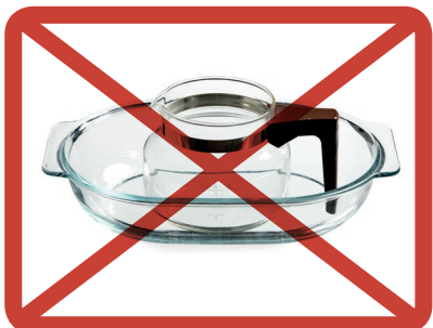
Lasiastiat » sekajätteeseen

Ethän laita: lasiastioita, lasiesineitä, lampuja, posliinia tai keramiikkaa.